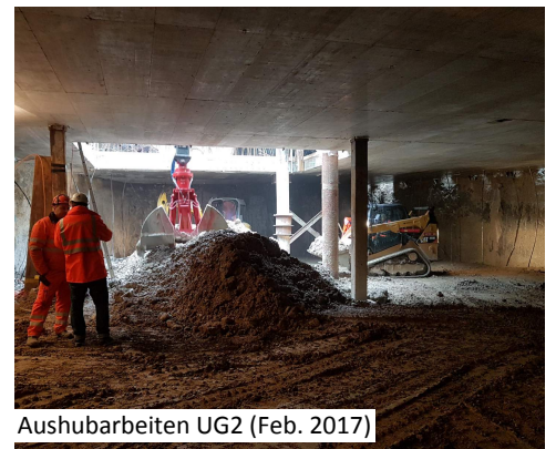
Aushubarbeiten UG2 (Feb. 2017)