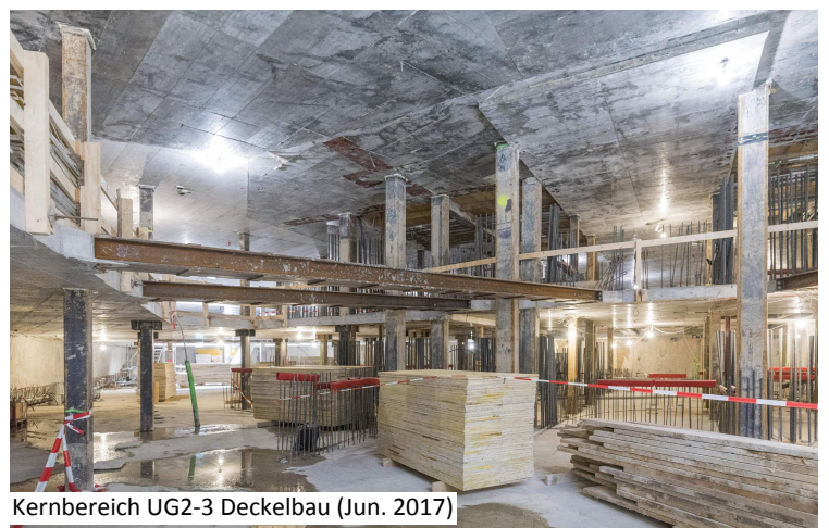
Kernbereich UG2-3 Deckelbau (Jun. 2017)