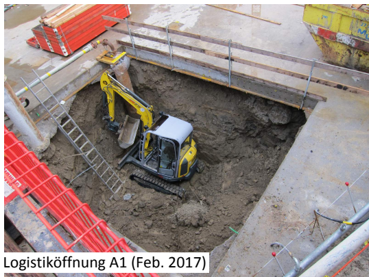
Logistiköffnung A1 (Feb. 2017)