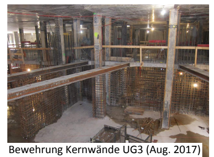
Bewehrung Kernwände UG3 (Aug. 2017)