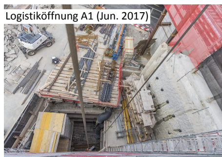
Logistiköffnung A1 (Jun. 2017)