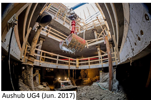
Aushub UG4 (Jun. 2017)