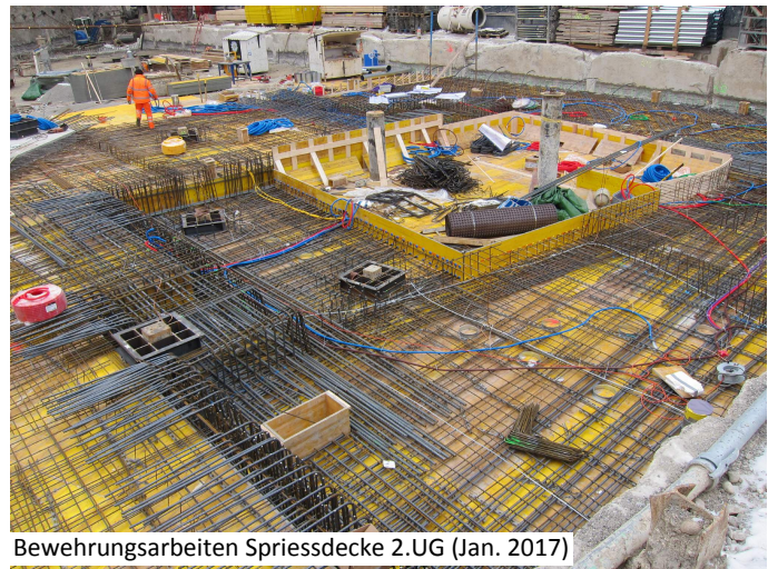
Bewehrungsarbeiten Spriessdecke 2.UG (Jan. 2017)