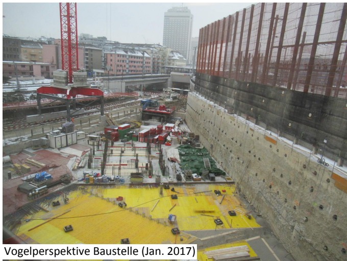
Vogelperspektive Baustelle (Jan. 2017)